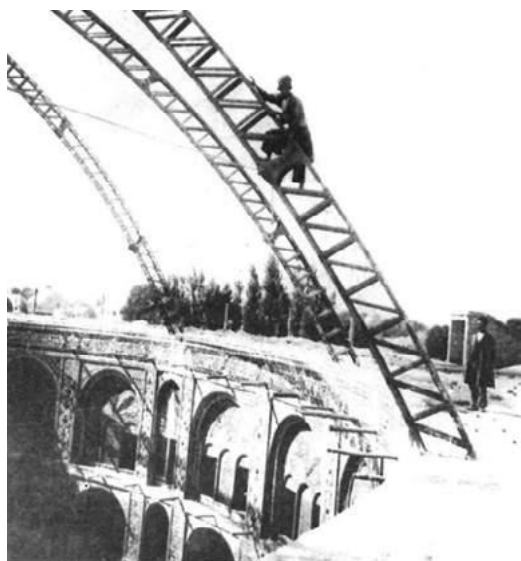
شکل ۴. سازه سقف تکیه دولت

در تکیه، منبری بیست‌پله‌ای (یا چهارده پله‌ای (Forugh, 1965) قرار داشت که دو دیواره جانبی آن از مرمر یکپارچه بود. بلندی آن حدود یک طبقه تکیه بود و به سفارش معیرالممالک در یزد ساخته شده بود (Zoka, 1970; Mansourifard, 1996). این منبر را در زمان انقلاب مشروطه از تکیه خارج کرده و در میدان توپخانه گذاشته بودند و شیخ فضل‌الله نوری بر آن سخنرانی می‌کرد (He-dayat, 1984). در چهار طرف تکیه، حوض‌های پر آبی قرار داشت که نوجوانانی با لباس عربی، غالباً بر اساس نذر والدینشان، سقایی حاضران در تکیه را بر عهده داشتند (Ojhen, 1983). در زمستان برای تأمین گرما در چند جا منقل می‌گذاشتند (Forugh, 1965). بر اساس وصف‌هایی که از فضای داخلی تکیه دولت برجا مانده است، می‌توان گفت که تزئین در آن بیش از معماری کلی و نمای بیرونی اهمیت داشته است، به‌ویژه استفاده از شمع‌دان‌های چند شاخه و دیوارکوب‌ها و چلچراغ‌ها و شمع‌ها و مانند این‌ها که نورپردازی فضای تکیه را چشمگیر می‌کرد. چلچراغی در وسط سقف قرار داشت (Forugh, 1965). که چندی با نیروی برق روشن می‌شد (Curzon, 1970). بخشی از نور تکیه، به‌ویژه سکوی وسط، از چراغ‌های لاله فنی با کاسه بلور که فراش‌ها حمل می‌کردند، تأمین می‌شد (Mostofi, 2005).