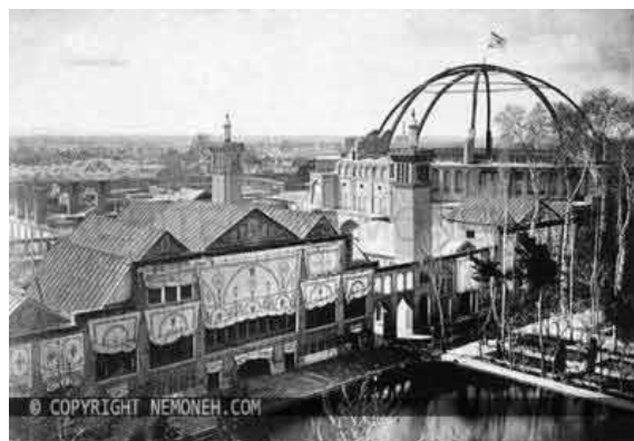
شکل ۴. دارالخلافه ناصری

تکیه دولت، بزرگ‌ترین آملی‌تئاتر ایران در دوره قاجاریه و به دستور ناصرالدین‌شاه ساخته شد (Pourmand and Lezgi, 2008). ساختمان تکیه دولت مدور آجری به قطر تقریبی شصت متر و ارتفاع حدود بیست‌وچهار متر بود و مساحتش را دو هزار و هشتصد و بیست و چهار متر مربع ذکر کرده‌اند. این ساختمان سه طبقه و با سردابه چهار طبقه داشت (Riyahi, 1968). در اطراف صحن بیست طاق (هر یک به عرض هفت و نیم متر)، با دیوارها و ستون‌های کاشی‌کاری قرار داشت. روی طاق‌ها اتاق‌هایی در دو طبقه ساخته شده بود. اتاق‌های طبقه اول ویژه وزراء و حکام ولایات بود که با نظارت ناظر (کارپرداز کاخ، فراشبافی) میان ایشان تقسیم می‌شد (Ojhen, 1983). اتاق‌های طبقه دوم ارسی داشت و مخصوص بانوان حرم بود (Orsolle, 1973). طبقه سوم جایگاه نقاره‌چی‌ها بود که با نرده‌ای حفاظت می‌شد (Ojhen, 1983). کارگردان و مدیر تعزیه را معین‌الکاء می‌گفتند. معین‌الکائی که تعزیه‌گردان تکیه دولت بود، خود موسیقیدانی مطلع بود و در کار خود مهارت داشت. در هر گوشه از ایران که خواننده یا تعزیه‌خوان خوش‌صدایی می‌دید، او را به مرکز می‌آورد و وارد دستگاه خویش می‌کرد (Mashhoun, 2009).