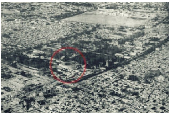
شکل ۳. تکیه دولت در کنار عمارت‌های دارالخلافه

تکیه دولت از دو جنبه دارای ویژگی‌های ارزنده است. اول اینکه بخشی از تاریخ معماری و شهرسازی ایران است که در پی یک تداوم تاریخی و با نگاهی به تحولات صنعتی غرب شکل گرفته بود. در درجه دوم درون‌مایه تکیه دولت، فضایی برای اجرای نمایش سنتی تعزیه بود که ریشه‌های طولانی در تاریخ شیعه داشته و با تخریب آن در واقع سیر قهقرایی این شیوه نمایشی را شاهد بودیم (Pourmand and Lezgi, 2008). در تکیه بزرگ و با شکوه دولت که به دستور ناصرالدین‌شاه مجاور محله ارگ ساخته شده بود؛ در روزهای عزاداری مجالس تعزیه با تجمّل و شکوه بسیار و با شرکت بهترین خوانندگان (با لباس‌های فاخر و گاه مزین به جواهر) در حضور شاه برگزار می‌شد (Mashhoun, 2009).