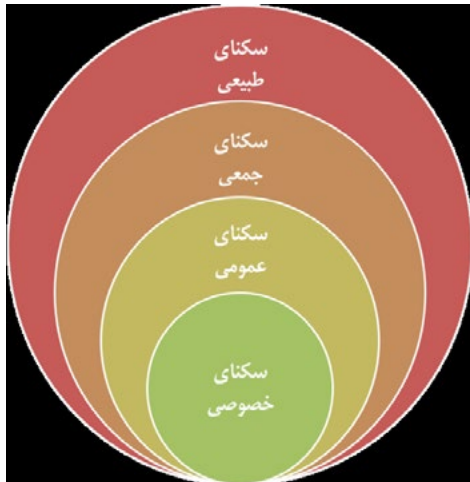
شکل ۱. سلسله‌مراتب تقسيم‌بندى فضاى اگزستانس بر اساس اندیشه هايدگر

به نام کيهان‌شناخت وجود داشت که تا حدودى در نقش جغرافياى امروز عمل مى‌کرد.