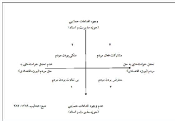
نمودار شماره ۱: مدل الگوی مشارکت ساکنین در محله . (Andalib, 2010:382)

نتایج و فرآیند برنامه‌ریزی‌ها می‌باشد تفاوت زیادی وجود دارد. (Ziari, Pahiz and Mahdnejad, 2009:212)